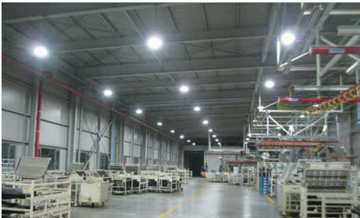
Obr. Typická aplikace High bay svítidla